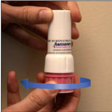
1. Vặn phần đáy như trên để mở nắp