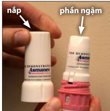
2. Đây là nắp và phần ngậm