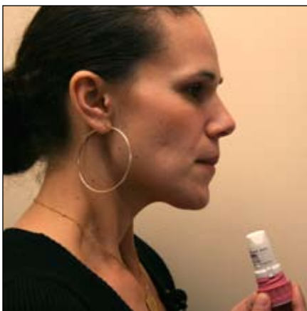
5. Giữ hơi thở trong 10 giây nếu được