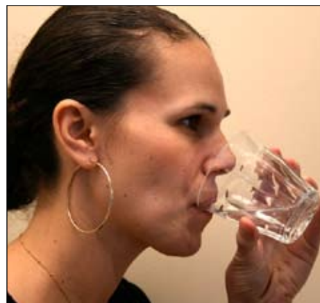
6. Súc miệng bằng nước và phun RA