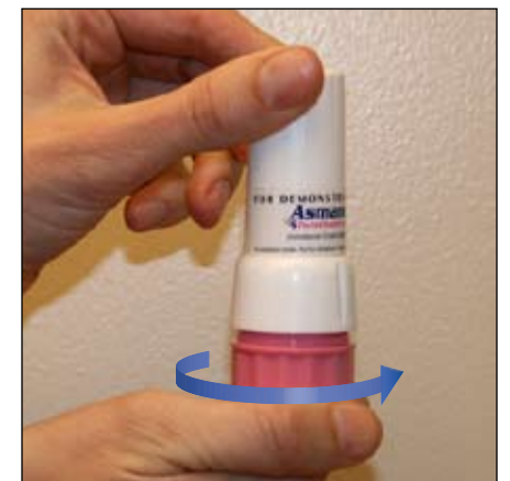
7. Đậy nắp lại, vặn để đóng lại