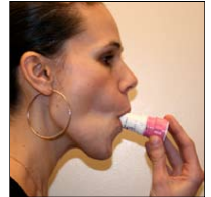
4. Ngậm ở bộ phận ngậm. Thở VÀO nhanh và sâu