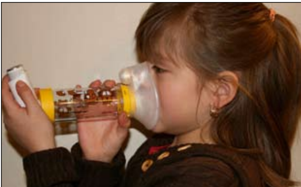
4. Sente-se de forma ereta, coloque a máscara sobre o nariz e boca