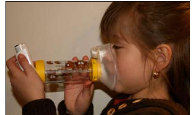
6. Inspire e expire seis vezes