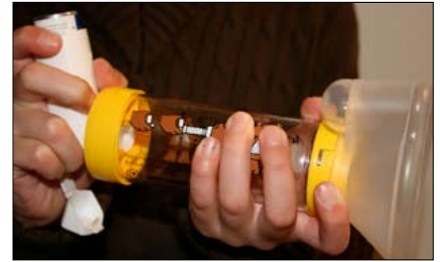
3. Conecte-o ao espaçador