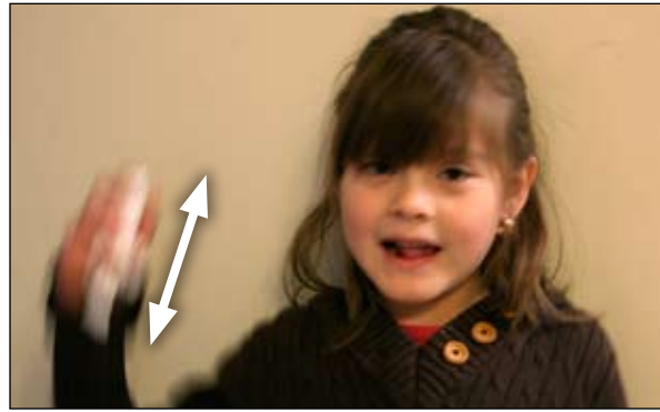
2. Chacoalhe o inalador