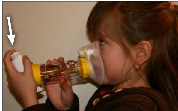
5. Pressione para baixo aqui. Isso libera o medicamento para o espaçador