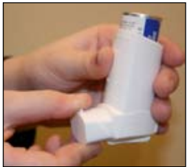
1. Tire a tampa do inalador