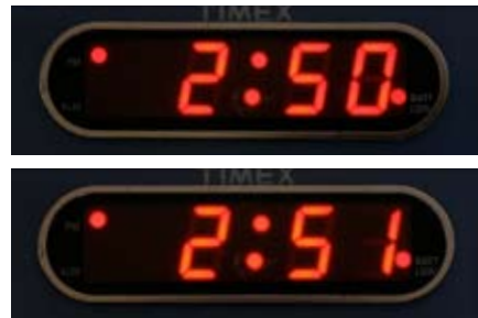
Se precisar de outra dose do medicamento, espere 1 minuto e então repita os passos de 5 a 9