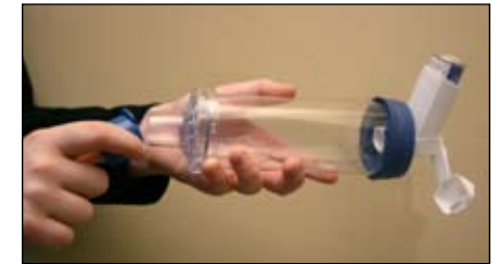
4. Tire a tampa do espaçador