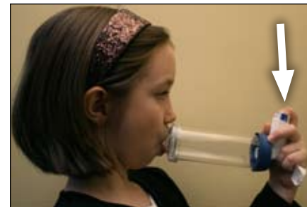
7. Pressione para baixo aqui