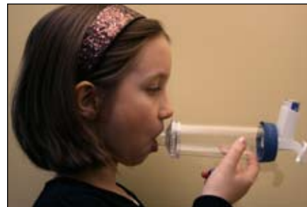
6. Feche seus lábios ao redor do bocal