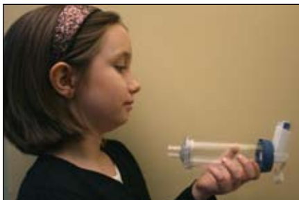
9. Segure sua respiração por 10 segundos se puder. Depois solte o ar lentamente