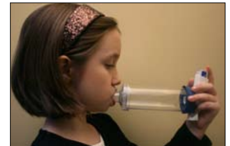
8. Hít VÀO chậm và sâu