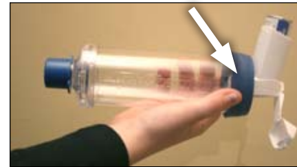
3. Gắn vào ống điều hòa